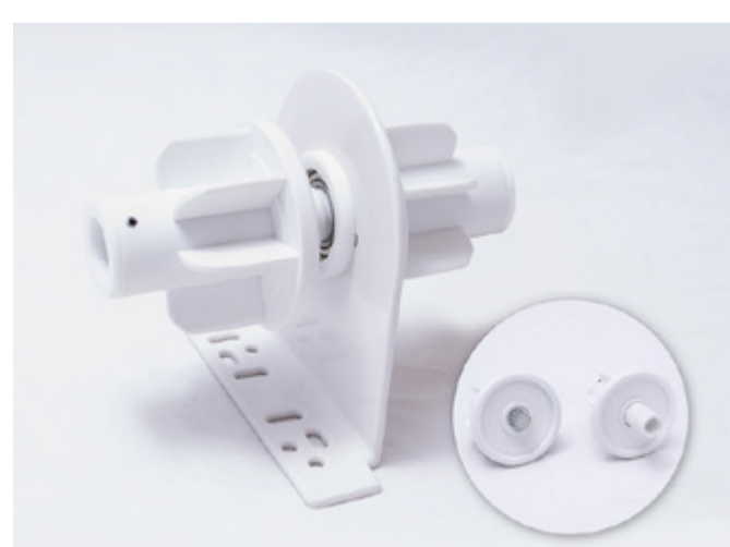
MOVATTI MIDDLE SUPPORT 52MM