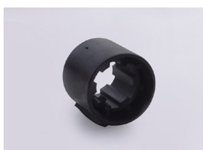
A2305 MOVATTI DRIVE ADAPTER PARA TUBO RANURADO