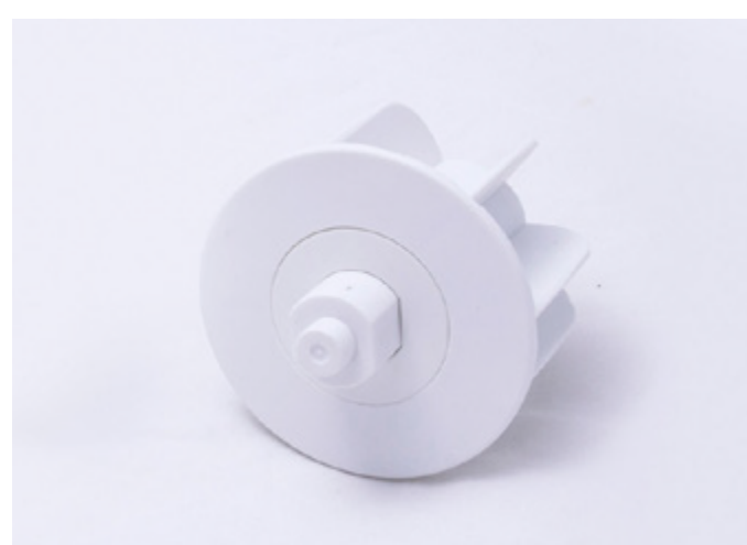
IDLER 52MM MOVATTI