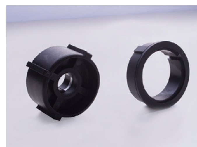
MOVATTI CROWN ADAPTAR A2329 MOVATTI TUBO DE 55MM PLUS