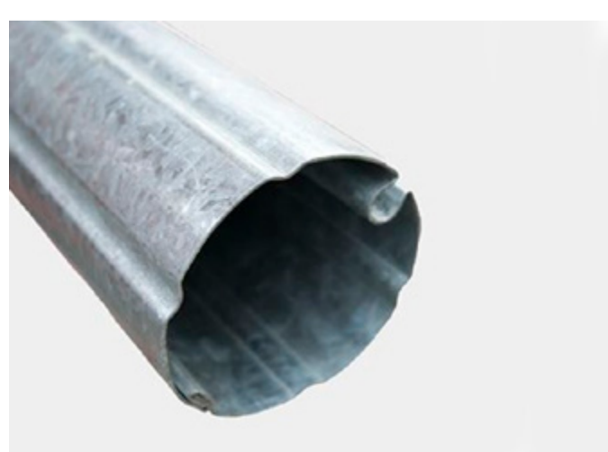
TUBO TOLDO CAIDA VERTICAL BRAZO RETRACTIL