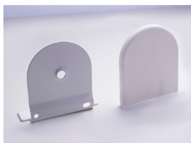
MOVATTI BRACKET A3633