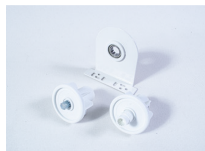
MIDDLE SUPPORT 43MM