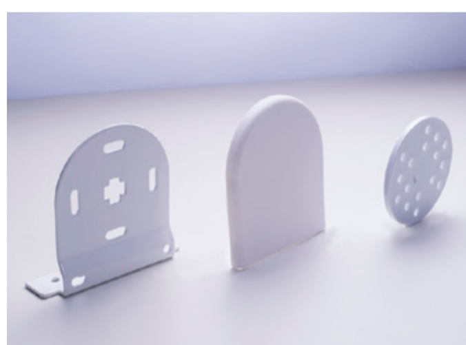
MOVATTI BRACKET A3634+A3632