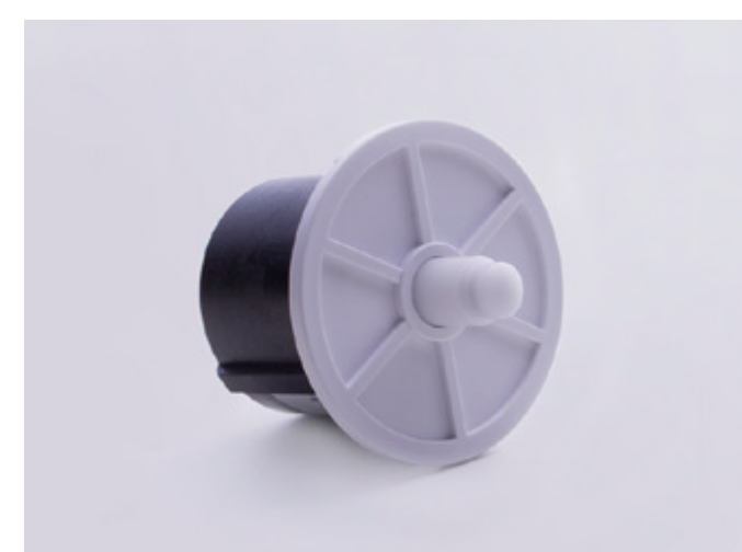
MOVATTI CROWN DRIVE ADAPTER A2305-01 PARA TUBO RANURADO